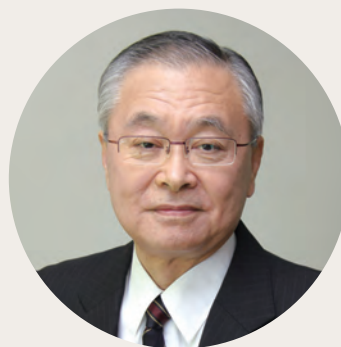
長野県飯田保健所長 佐々木 隆一郎 (次期 全国保健所長会会長)