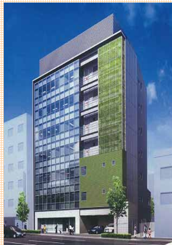
平成20年6月1日から板橋区保健所5階に開設。 (住所：板橋区大山東町32-15)

【区長マニフェストより】女性の生涯を通じた健康づくりのための支援や、安心して相談できる拠点づくりを推進します。