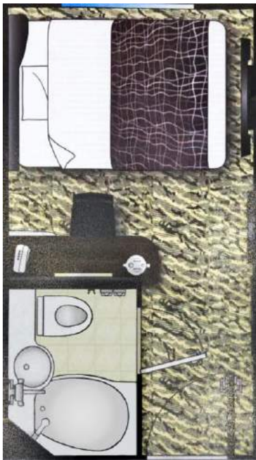
거실 (11㎡ 방의 예)

반드시 사진과 같은 방을 확보할 수 있는 것은 아니므로 주의하시기 바랍니다.